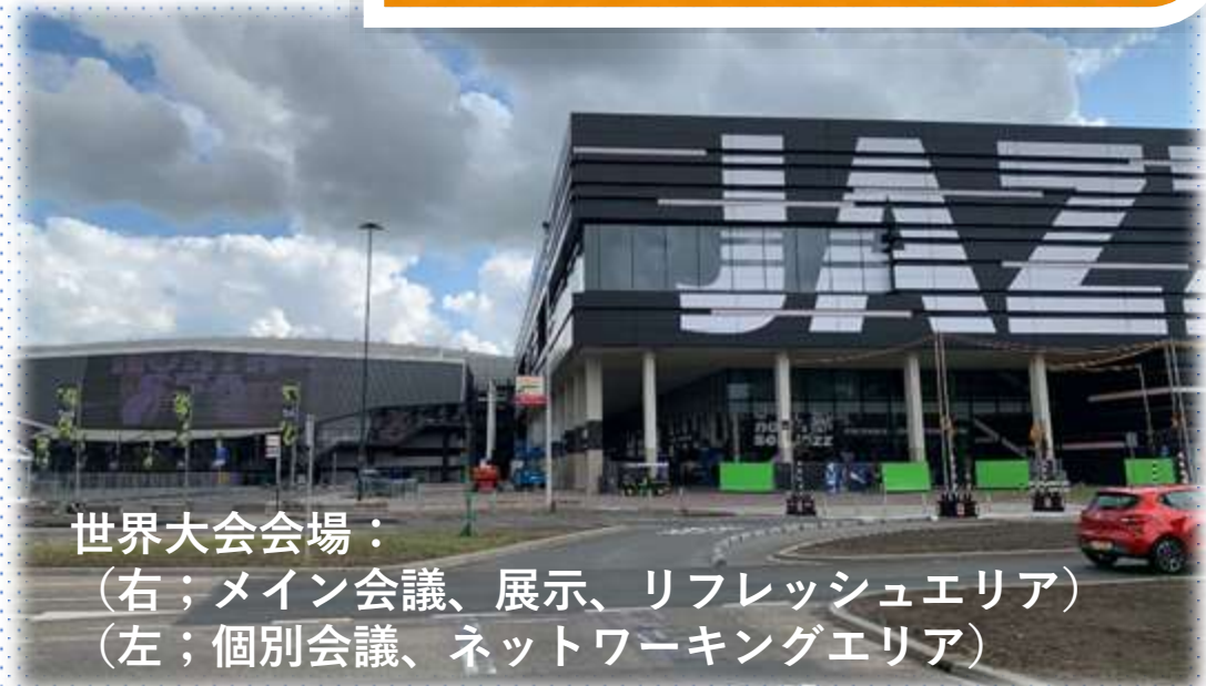
世界大会会場： (右；メイン会議、展示、リフレッシュエリア) (左；個別会議、ネットワーキングエリア)