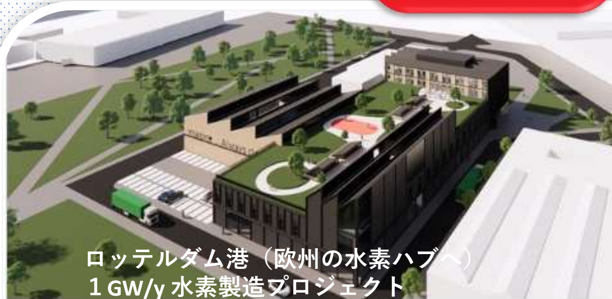
ロッテルダム港（欧州の水素ハブへ） 1 GW/y 水素製造プロジェクト

portofrotterdam.com Shore power from Rotterdam Shore Power for DFDS terminal in Vla... Sustainability Shore power from Rotterdam Shore Power for DFDS terminal in Vlaardingen