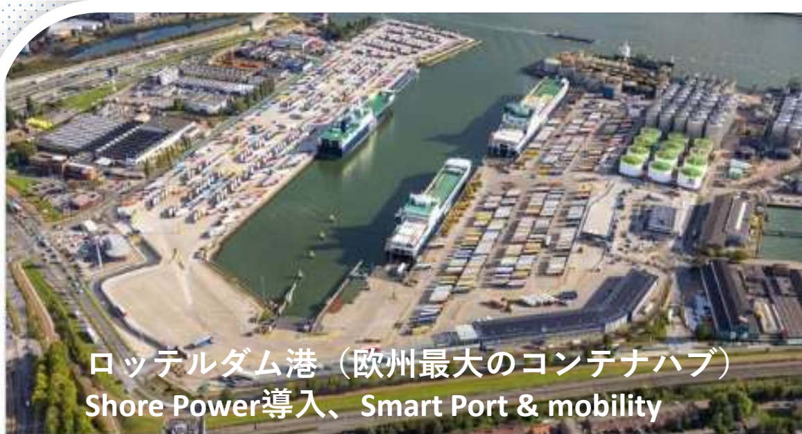
ロッテルダム港（欧州最大のコンテナハブ） Shore Power導入、Smart Port & mobility

portofrotterdam.com Shore power from Rotterdam Shore Power for DFDS terminal in Vla... Sustainability Shore power from Rotterdam Shore Power for DFDS terminal in Vlaardingen